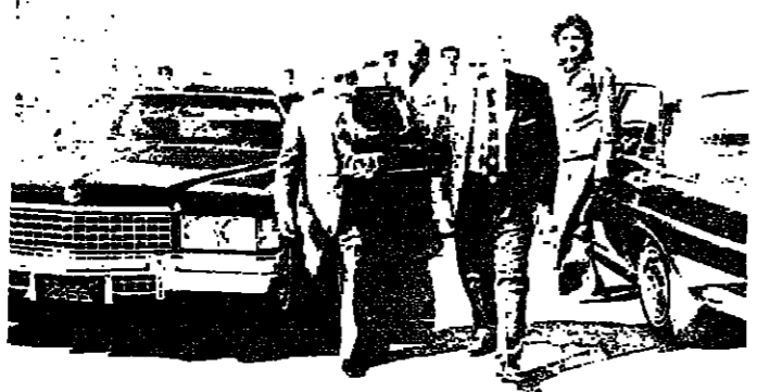
الرئيسان كرامي وسلمم انشاء لهما في صور صباح أمس